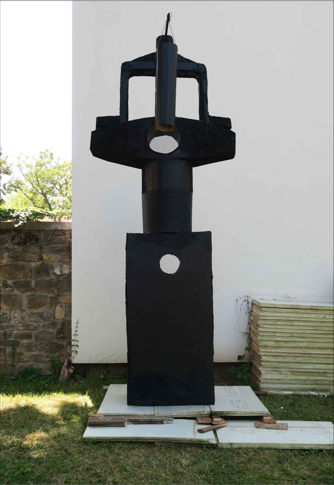
MODEL ZVONIČKY VE SKUTEČNÉ VELIKOSTI AUTOR: IVANA ŠRÁMKOVÁ